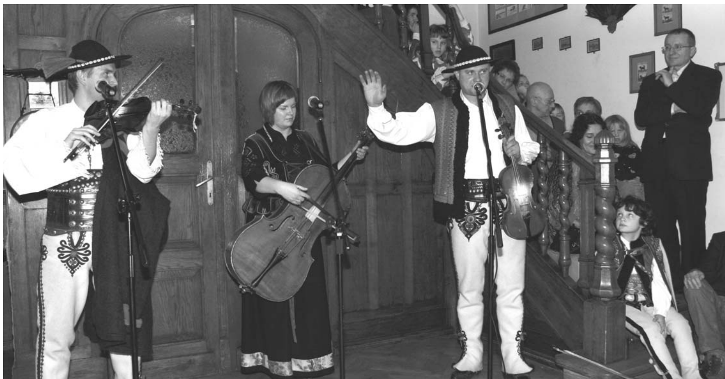
Występ zespołu Treburnie Tutki