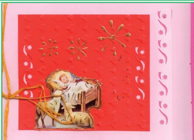
Kartka świąteczna wykonana przez młodzież z Ośrodka Samopomocy Społecznej przy ul. Błońskiej w Podkowie Leśnej

Pogody w sercach i za oknem, jasnych i ciepłych myśli, odwagi, pamięci o przyjaciółtach