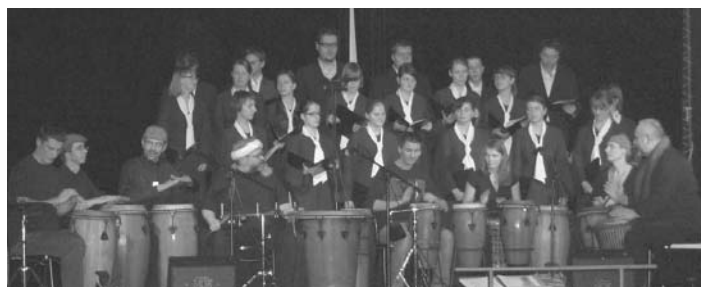
Zespół BĘBŃNY NIE-DZIEŁA.

Wszystkim zaangażowanym w mikołajkową akcję pomocy dla Konrada serdecznie dziękujemy.