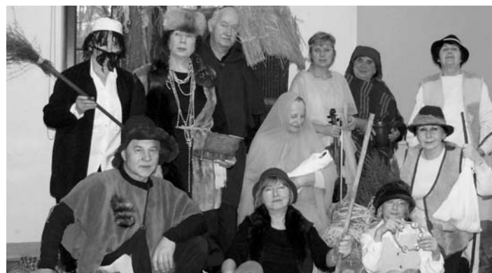
Dialog o narodzeniu Chrystusa.