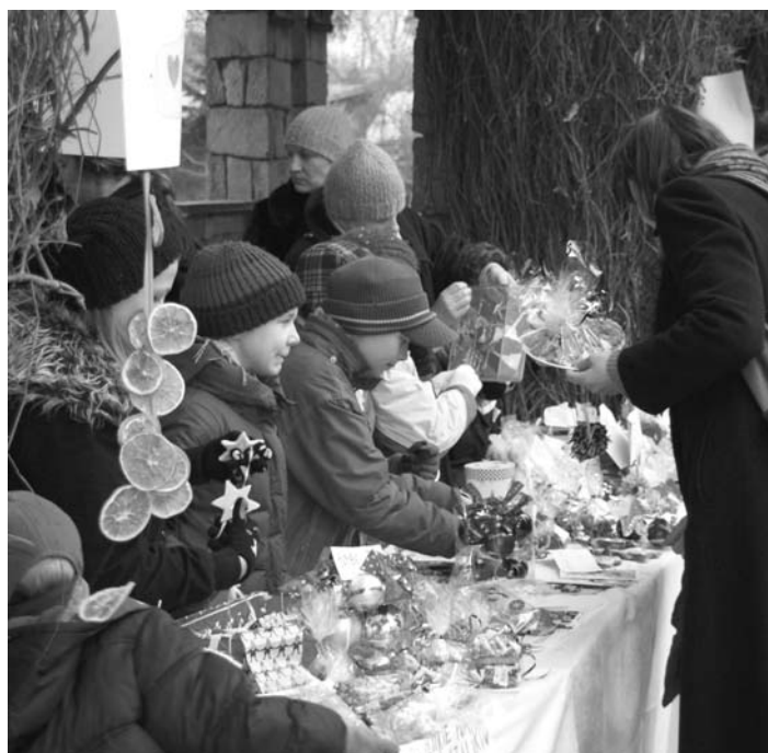
Mikołajkowy kiermasz.