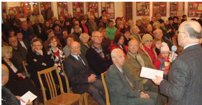
Otwarcie wystawy.

Uroczyste zamknięcie wystawy odbyło się 13 grudnia 2009 r.