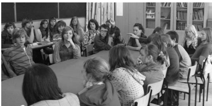
Szkolna debata.