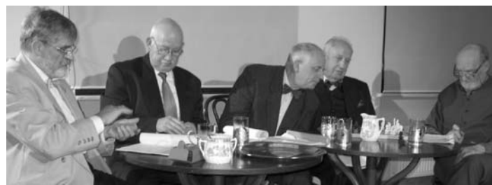
Opowieści profesora Tutki

Organizatorzy zastrzegają sobie prawo do zmian w programie.