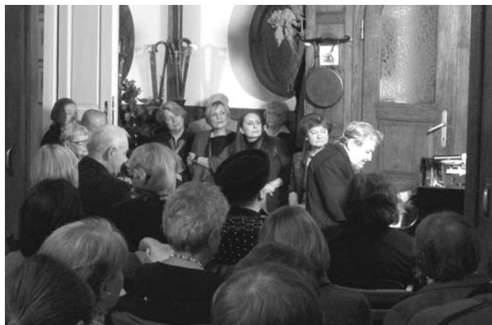
Gra Adam Makowicz

Jednym z najważniejszych, jeśli nie najważniejszym, pozostaje do dziś dom Anny i Jarosława Iwaszkiewiczów na Stawisku. Bywali tu za życia Gospodarzy zarówno artyści, a wśród nich Słonimski, Szymanowski, Miłosz, Lutostawski, jak i wybitni ludzie nauki, m. in. profe-