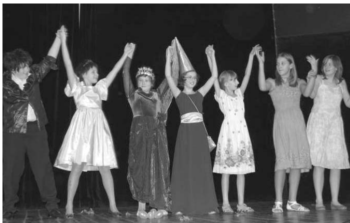
Mały Teatr z Piwnicy.