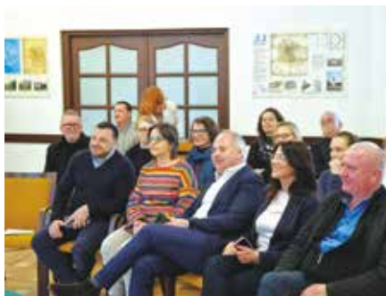
W uroczystościach uczestniczyła delegacja z miasta partnerskiego Piedimonte San Germano.