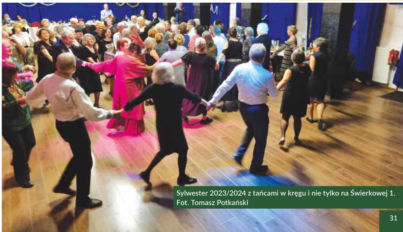
Sylwester 2023/2024 z tańcami w kręgu i nie tylko na Świerkowej 1.