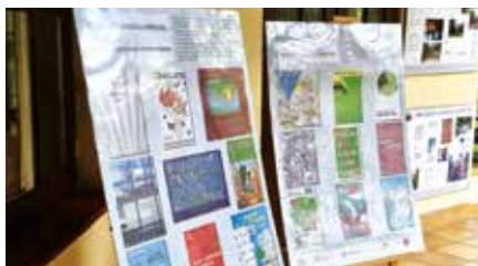
Dużym zainteresowaniem cieszyły się też tablice na temat życia w mieście i projektowania przestrzeni.