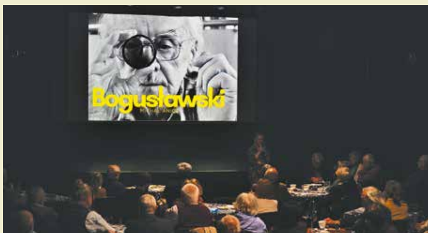
Publiczność zobaczyła 2 filmy o M. Bogustawskim oraz 7 fragmentów filmowych przygotowanych przez Ewę Golis.

Goście – wśród których znaleźli się uczniowie i współpracownicy profesora z czasów jego aktywności zawodowej, a także twórcy filmowi i telewizyjni, rodzina, przyjaciele i sąsiedzi podkowiecscy – mieli okazję nie tylko wysłuchać ciepłych wspomnień osób, którym dana była radość poznania Go, pracy z Nim oraz korzystania z Jego wiedzy i doświadczenia w sprawach kultury, ale także zobaczyć filmy, które tworzyły wielowymiarowy portret mistrza.