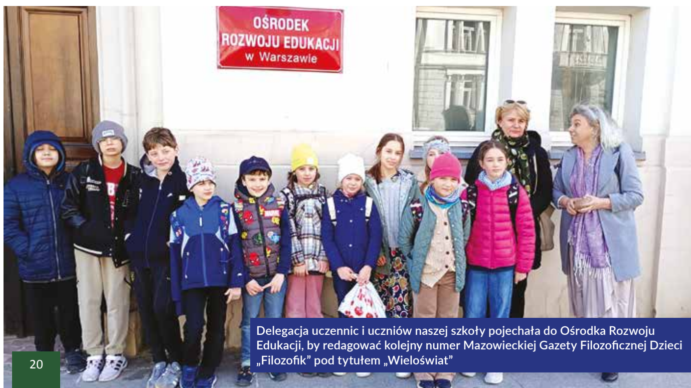
Delegacja uczennic i uczniów naszej szkoły pojechała do Ośrodka Rozwoju Edukacji, by redagować kolejny numer Mazowieckiej Gazety Filozoficznej Dzieci „Filozofik” pod tytułem „Wielościat”