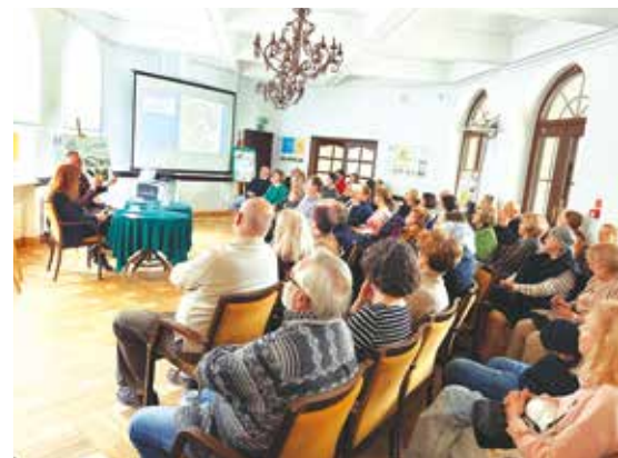
Uczestnicy dyskusji na temat „Czy warto projektować miasta?”.