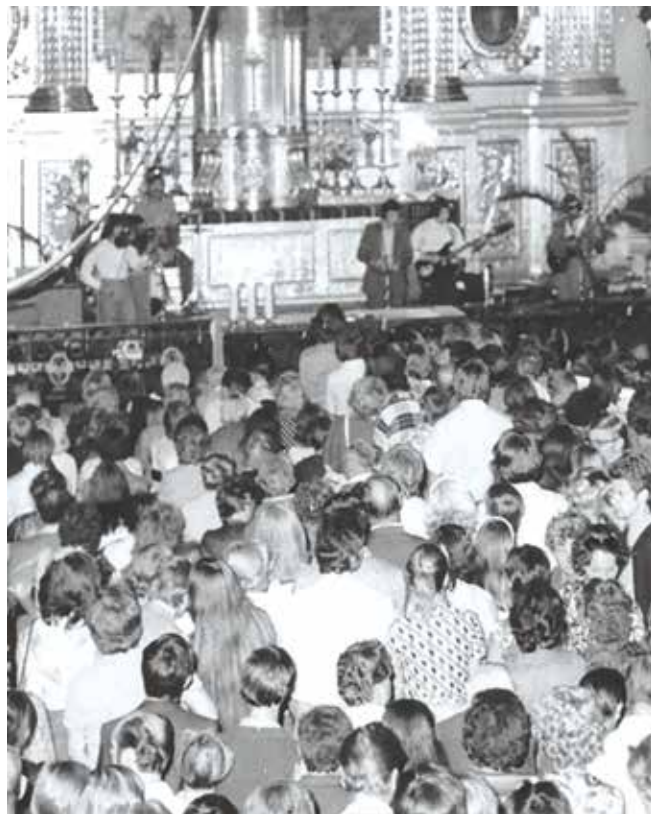
Trapiści w kościele Św. Krzyża w W-wie, 1969