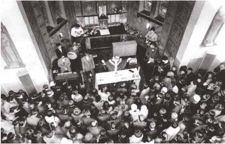
Trapiści w kościele w Podkowie Leśnej, 1969

Było to coś, co znaczyło w naszym życiu najwięcej, co robiliśmy z pełnym przekonaniem, bez żadnego, poza duchowym, wynagrodzeniem – wspominali muzycy zespołu Trapiści.