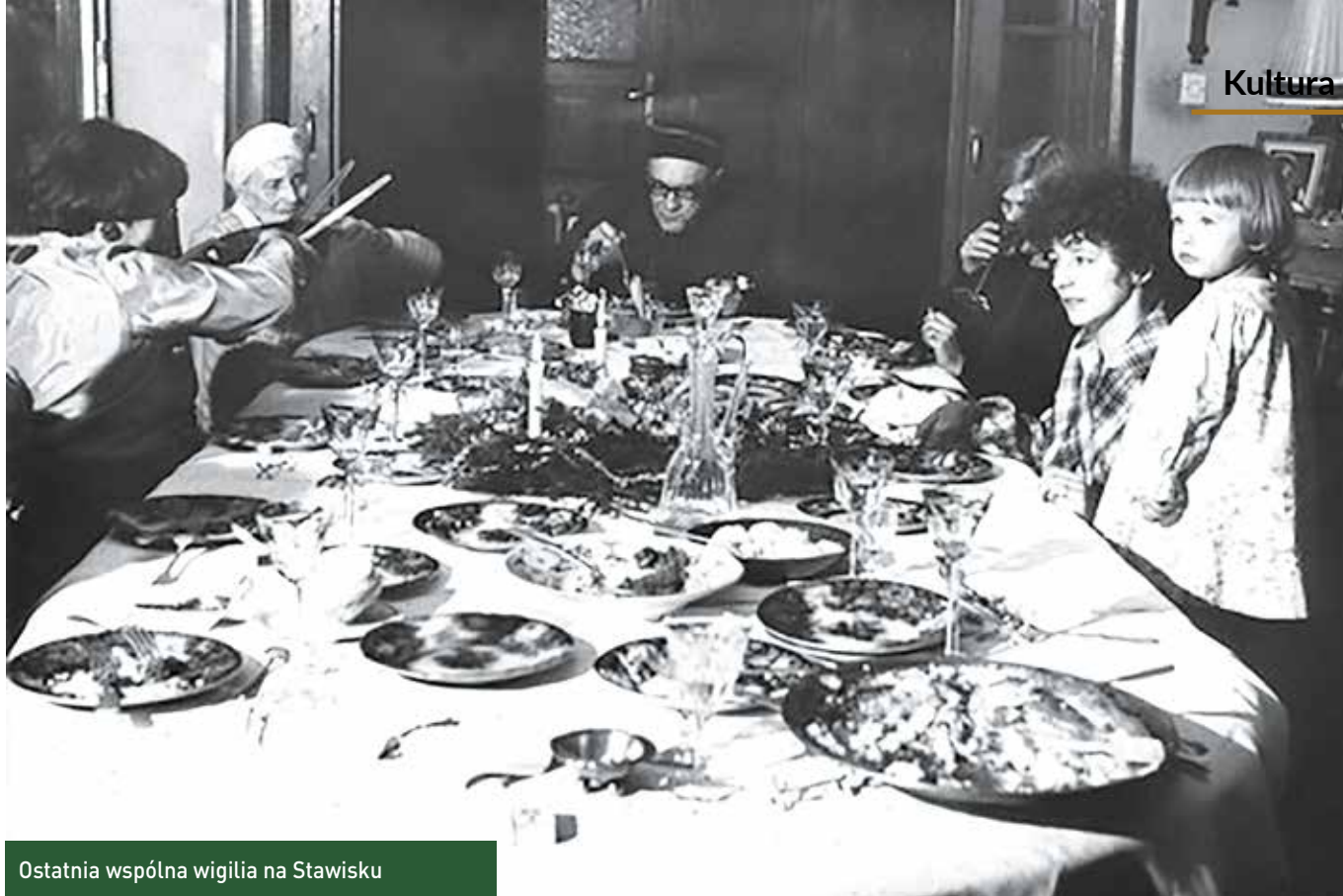
Ostatnia wspólna wigilia na Stawisku