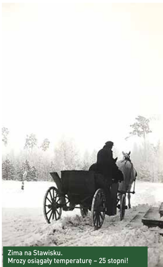
Zima na Stawisku. Mrozy osiągały temperaturę – 25 stopni!

Muzeum A. i J. Iwaszkiewiczów w Stawisku