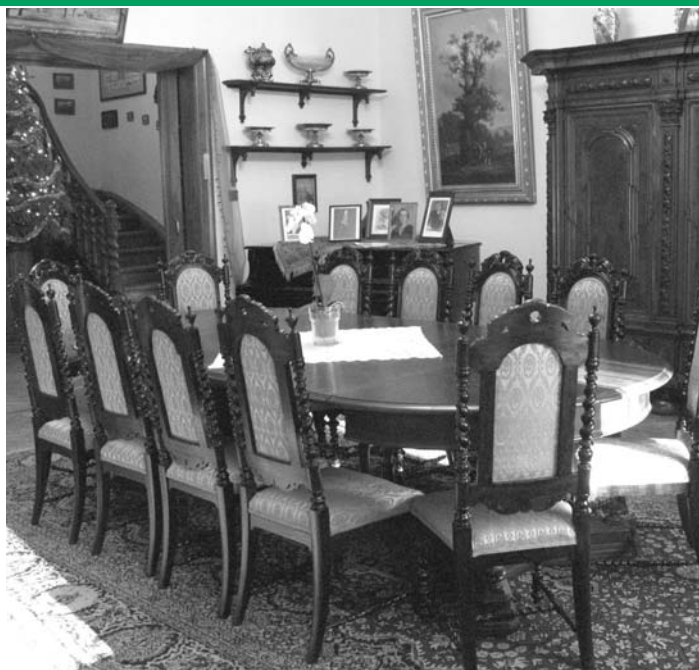
Jadalnia w Stawisku