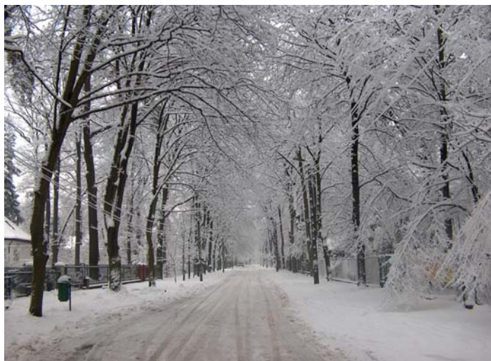
Ulica Lilpopa