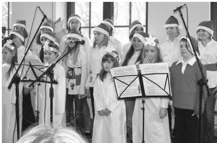
Grudzień 2009 r. Mali kołędnicy z Pałacu Młodzieży w Warszawie

Dyrektor Centrum Kultury i Inicjatyw Obywatelskich