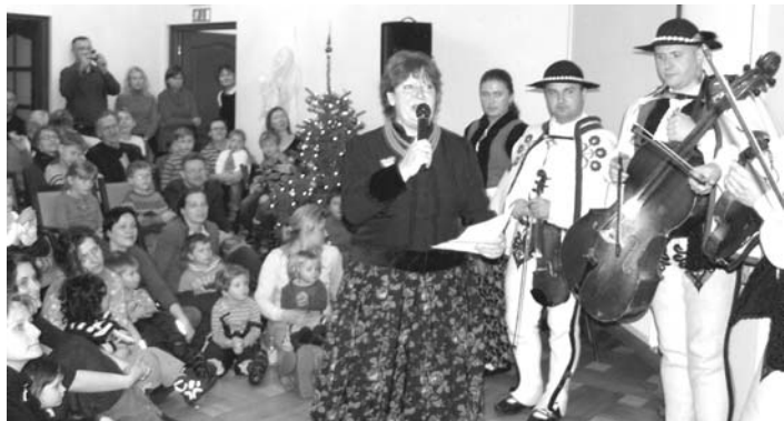
Styczeń 2010 r. Spotkanie z zespołem z Poronina