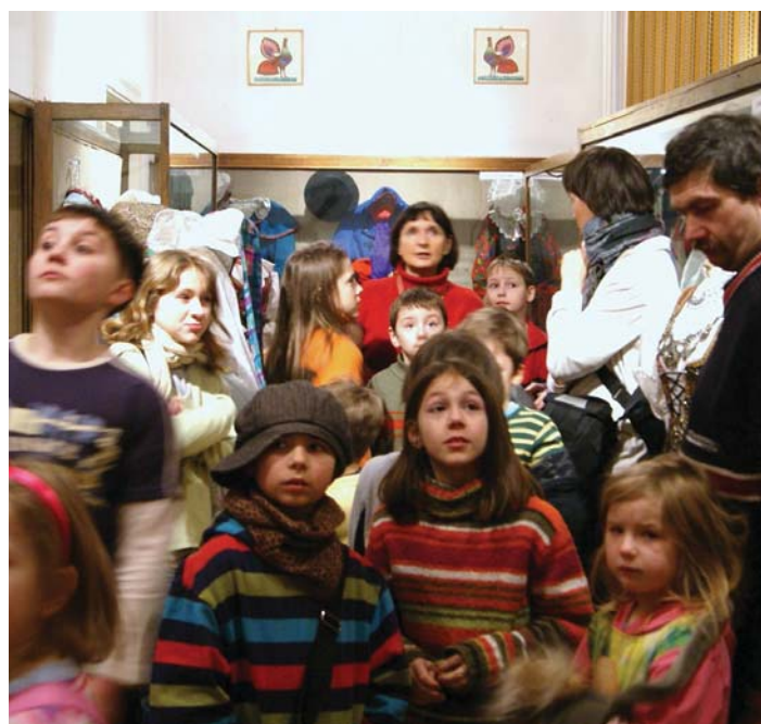
Wycieczka do siedziby "Mazowsza" w Karolinie