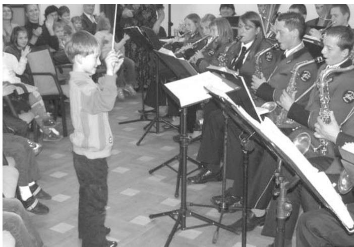
Październik 2009 r. Młodzieżowa Orkiestra Dęta OSP z Kask