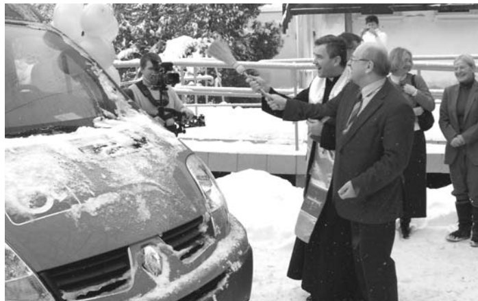
Nie strasza teraz żadna droga

Na tym nie koniec. Oprócz zajęć w Domu i udziału w imprezach w naszym mieście Uczestnicy biorą udział w szeregu przedsięwzięć można rzec zewnętrznych. Brali udział w Mazowieckim Przeglądzie Twórczości Artystycznej Środowiskowych Domów Samopomocy (był to już VIII-y taki przegląd), w Powiatowym Przeglądzie Twórczości w Grodzisku Mazowieckim, w imprezie-przeglądzie dorobku podobnych Domów o wdzięcznej nazwie "Ulica Integracyjna" w Warszawie, w Mazowieckich Spotkaniach Pracowni Terapeutycznych pod hasłem "Nie święci garnki lepią" - hasło cudzo!