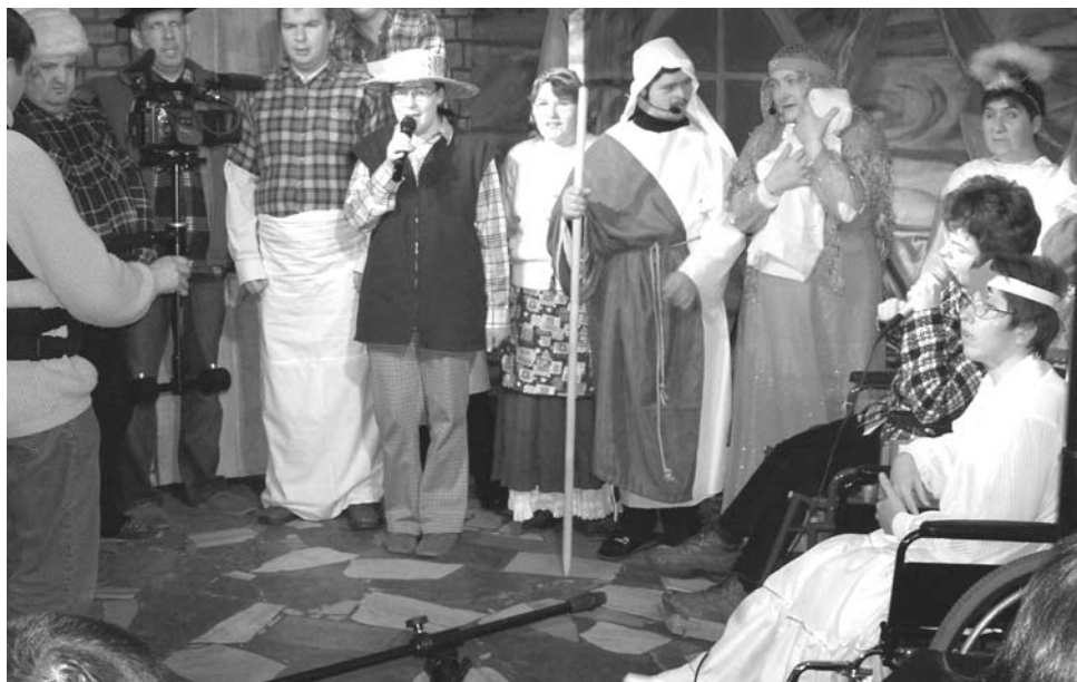
...Nie było miejsca dla Ciebie...

Przedstawienie poprzedzone było gościnnym występem-koncertem uczniów Szkoły Muzycznej I-go stopnia z Grodziska Mazowieckiego (duże brawa).