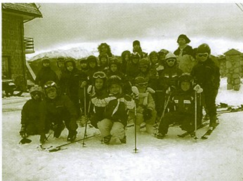
Młodzi narciarze z najliczniej reprezentowanej na zimowisku klasy 1 szkoły podstawowej.