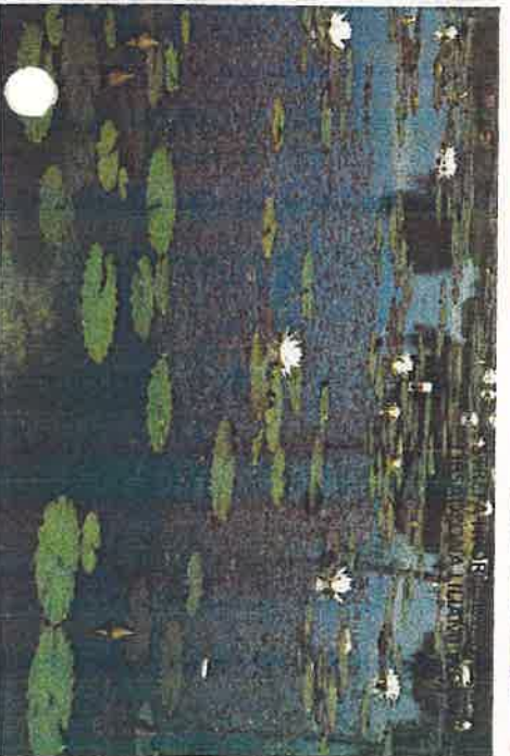
FILTR MINERALNY/STREFA HYDROBOTANICZNA OBSADZONY ROŚLINNOŚCIĄ SZUWAROWĄ