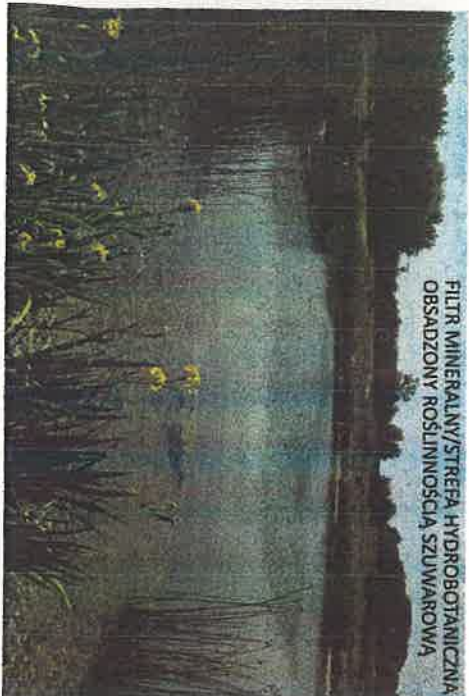
FILTR MINERALNY/STREFA HYDROBOTANICZNA OBSADZONY ROŚLINNOŚCIĄ SZUWAROWĄ