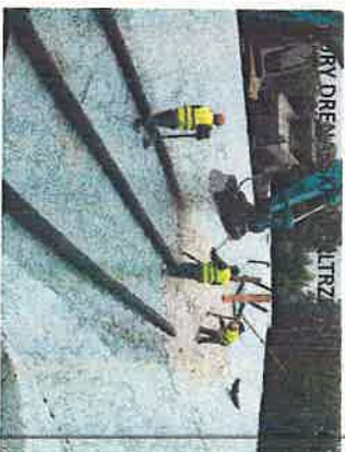
DRY DREWNIANY FILTR