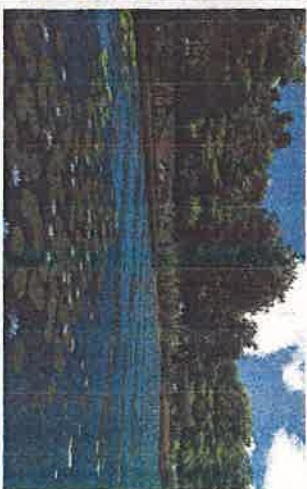
WERSJA NR 1 DREWNIANE PERGOLE NA TARASACH