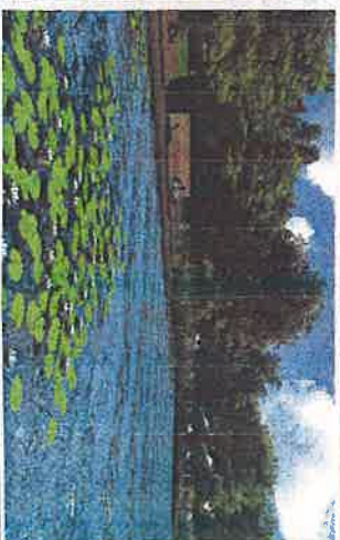
WERSJA NR 2 DREWNIANE PERGOLE ZASTĄPIONO PARASOLAMI