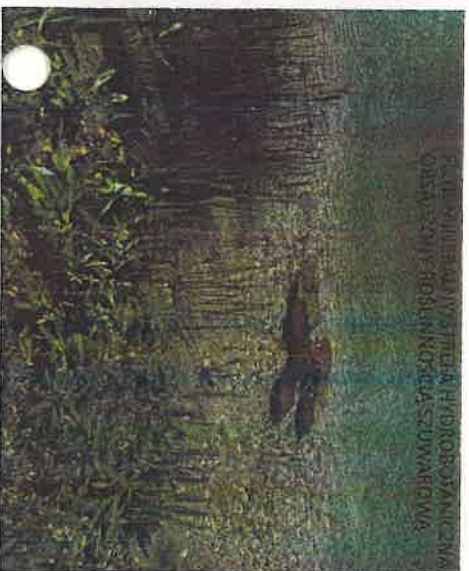
FILTR MINERALNY/STREFA HYDROBOTANICZNA OBSADZONY ROŚLINNOŚCIĄ SZUWAROWĄ